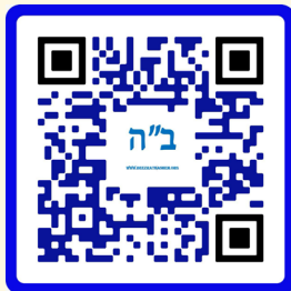
לספרי הרב אפרים כחלון שליט"א - טרוק

תותים (תות שדה) - הגם שיש מפרסמים שלא לאוכלם כלל העיקר להלכה שיש להוריד בזהירות את העלים בלי שיהיה פתח לחלל התות, לשרות כ- 5 דקות במים עם סבון, לרשרש היטב במים. לאחר מכן לרוקן את המים עם הסבון, לשרות שוב במים בלבד ולרשרש במים. בפעם השלישית לשטוף תחת זרם מים או לשרות במים בלבד ומותרים באכילה [נ.ב. אין לנקות את התותים בשבת באופן הנ"ל בשבת מחשש איסור בורר, לכן יעשה כן מלפני השבת].