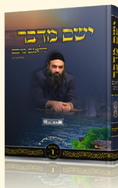
(מתוך ספרו של הרב ירון ראובן "ישם מדבר לאגם מים")

"כס"ף - ראשי תיבות כ'שרואה ס'כנה פ'ותח. הוא לא נותן צדקה אם הוא לא רואה שיש סכנה, יש אנשים מסכנים שצריכים להכניס אותם משמים למצבים לא נעימים כדי שיפתחו את הכיס שלהם, והנתניה שלהם כבר פחותה יותר ושוה רק "כסף".