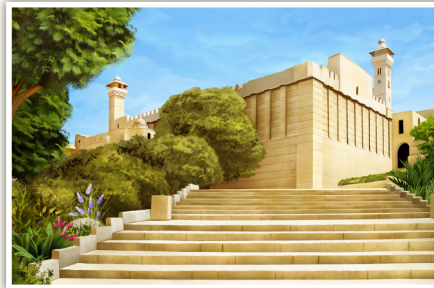
בשנה הבאה בירושלים הבנויה

אדם שהוא גאוותן הוא גם כפוי טובה, כי הוא לא חושב שהוא צריך להחזיר טובה על משהו שעשו לו, כי הכל מגיע לו, ולכן פרעה שעשה את עצמו אלוה, (מכילתא דרבי ישמעאל בשלח - מסכתא דשירה פרשה ח), ואמר על עצמו "לי יאורי ואני עשיתיני" (יחזקאל כט ג), כפר בטובתו של יוסף, ואחר כך בטובתו של מוקם, וכשתראה כפוי טובה תבין שהוא תלמיד של פרעה.